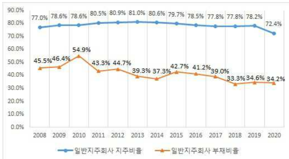
일반지주회사수 지주비율 및 부채비율(2020년 9월 기준)